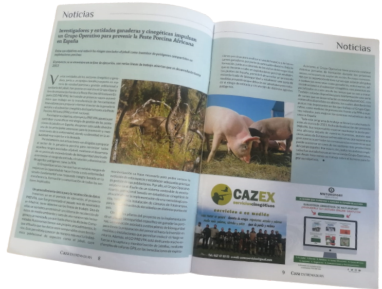
Extracto revista Caza Extremadura

En total, las cinco notas de prensa más la invitación a participar en los talleres se han enviado a 1575 contactos.