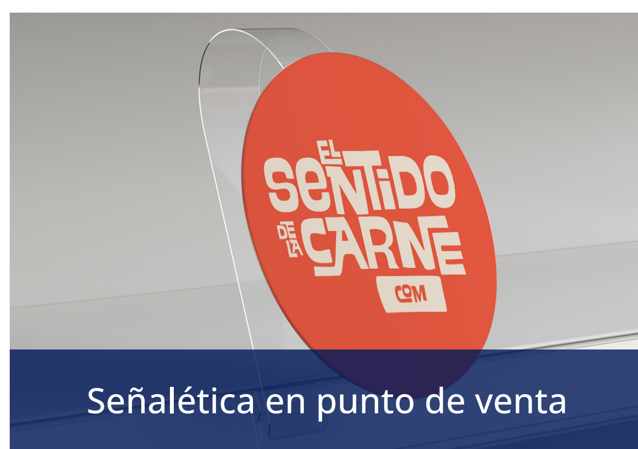
Señalética en punto de venta