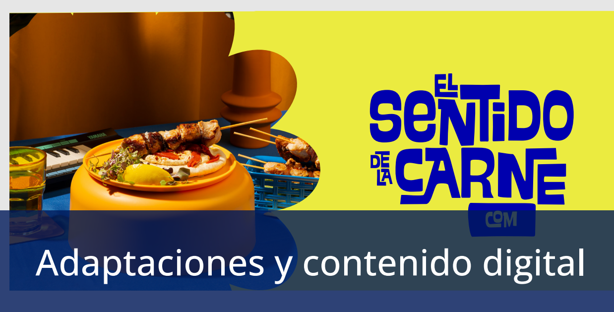
Adaptaciones y contenido digital