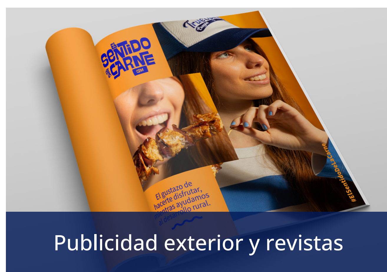
Publicidad exterior y revistas